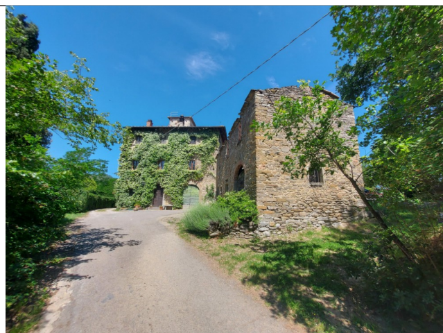
1. Prospetto SUD (luglio 2021)