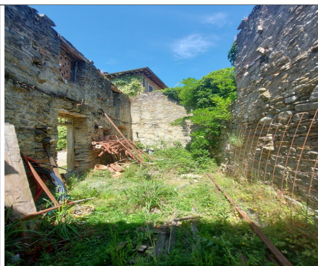
8. Interno (luglio 2021)