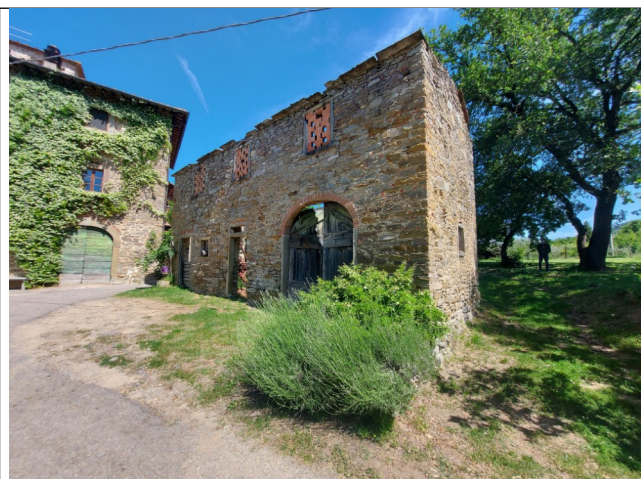
6. Prospetto SUD (luglio 2021)