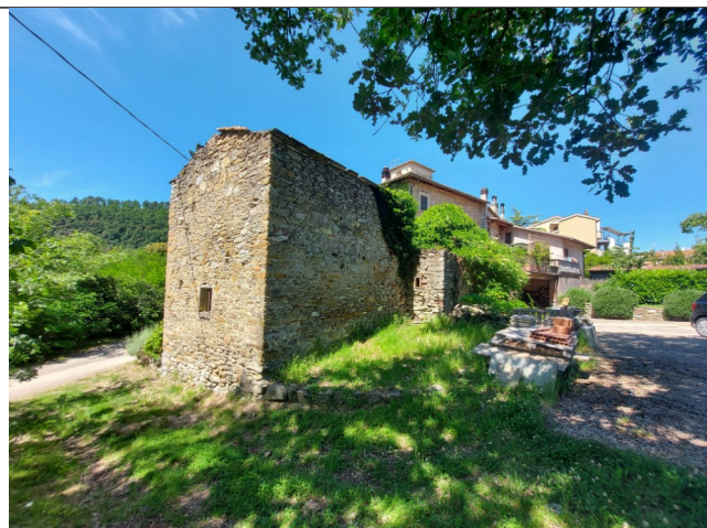
4. Prospetto EST (luglio 2021)