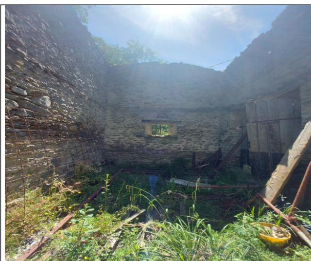
7.Interno (luglio 2021)