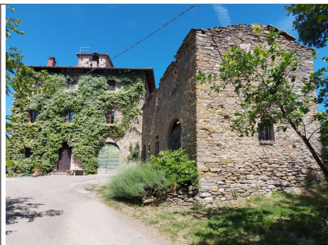
5. Prospetto SUD OVEST(luglio 2021)