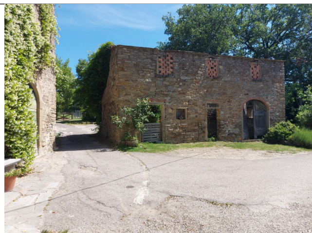
2. Prospetto OVEST (luglio 2021)