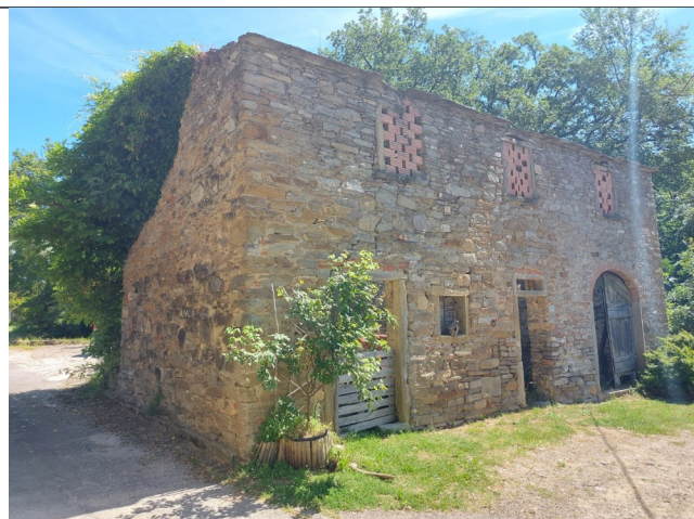
3. Prospetto NORD E OVEST (luglio 2021)