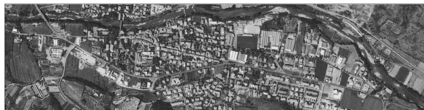
Tav. 3: Disciplina della Risorsa ineditativa e delle strutture funzionali e di relazione

DATA ADOZIONE: DATA REVISIONE: METRARI 2005 1:10000